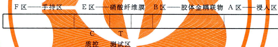
图 2 试纸条示意图

按说明书进行操作，从试纸加入样品液开始用秒表计时，直至液体达到图 2 所示 E 区与 F 区之间的交界线时停止计时，所用的时间记为( t )，用游标卡尺测量(A 区+B 区+E 区)的长度，记为( L )，则计算 L/t 即为移行速度，结果应符合 4.1.3 要求。