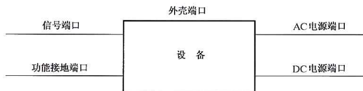
图 1 端口的例子