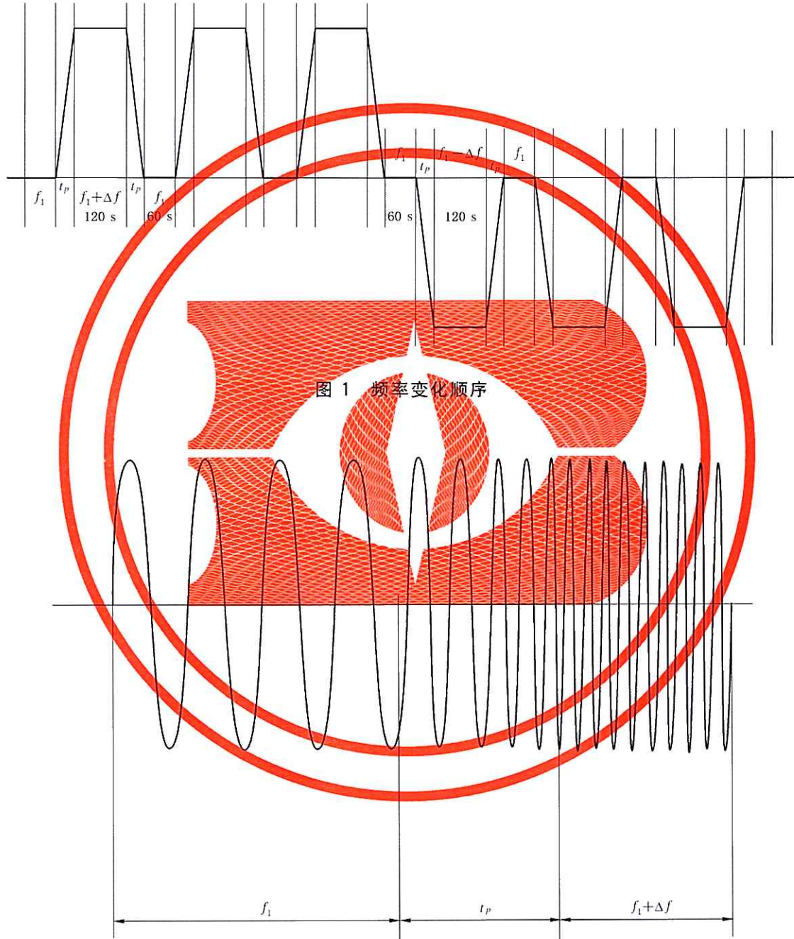
图 2 过渡期 t_p 的例子